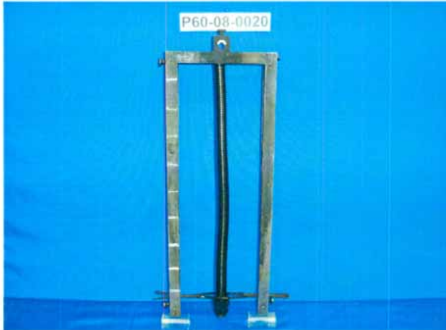
Probe vor der Prüfung