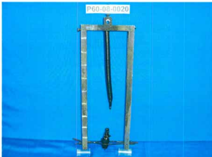
Probe nach der Prüfung