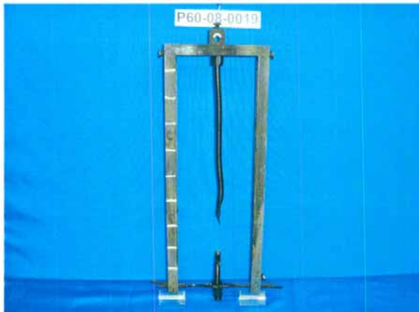
Probe nach der Prüfung