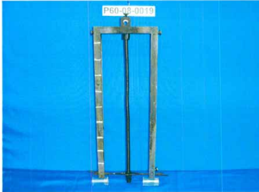
Probe vor der Prüfung