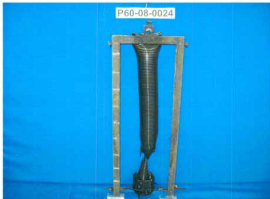
Probe nach der Prüfung