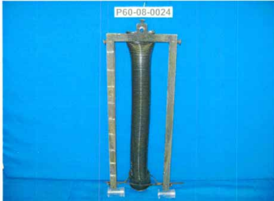
Probe vor der Prüfung