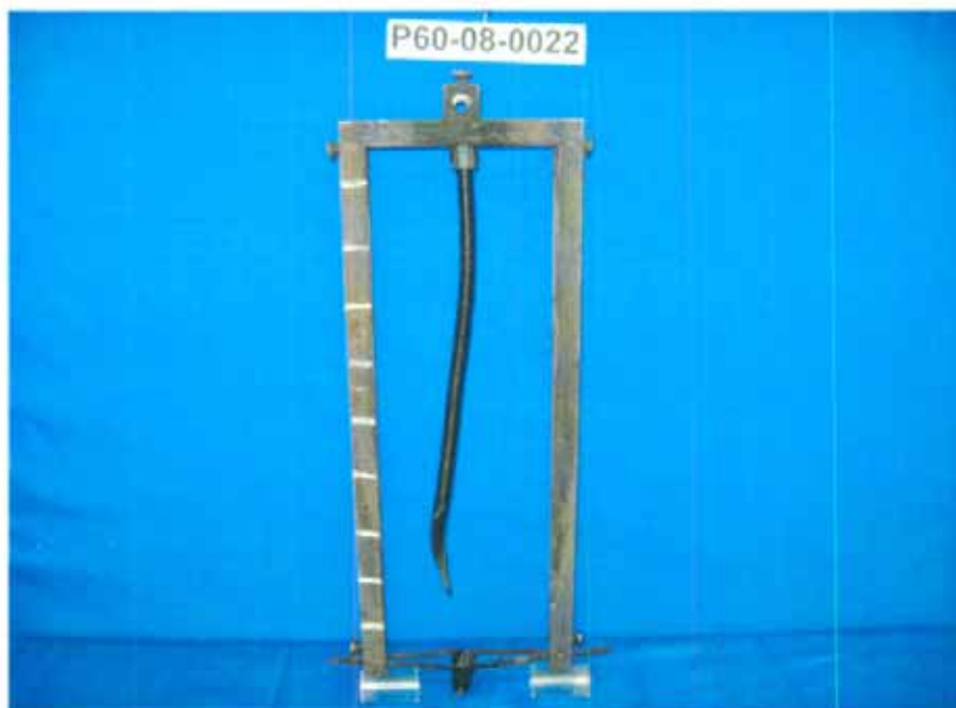
Probe nach der Prüfung