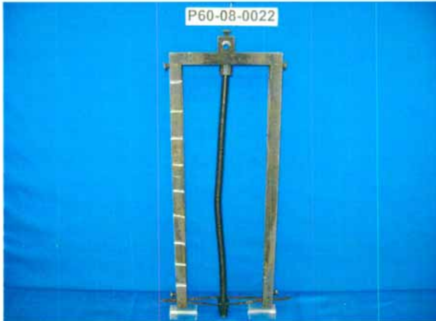
Probe vor der Prüfung